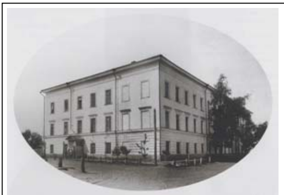
Здание войскового хозяйственного правления Сибирского казачьего войска в Омске. Фотография Г. Е. Катанева. 1896 год